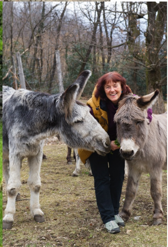
Gute Anfahrt und bis bald in der Asineria Erica